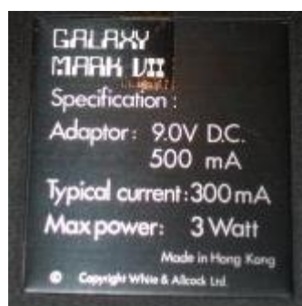
CXG Galaxy Mark VII