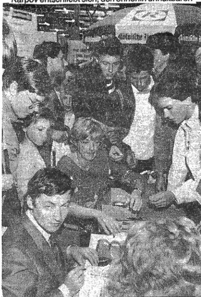
WM Karpov gab am Stand der Kölner Rundschaue Autogramme für einen guten Zweck: 1000 DM kamen für Kölns Romanische Kirchen zusammen!

18.- Dc7 Nun käme auf 19.c4 bxc4 20.bxc4 Sxe5! 21.Sxe5 Dxe5 und der Turm a1 ist angegriffen. Karpov entschließt sich, den ohnehin unhaltbaren