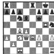
Stellung 16 W: Botwinnik – S: Pachmann Moskau 1947