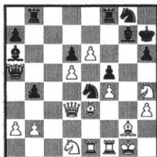
Stellung 14 W: Aljechin – S: Fletcher London 1928