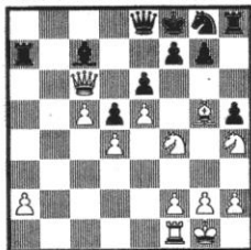
Stellung 13 W: Geller – S: Karpow UdSSR Meisterschaft 1976

Ersehen Sie die Antwort aus folgender Tabelle.