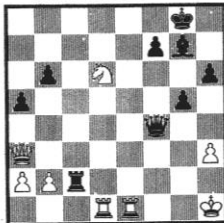
Stellung 18 Vidmar - Euwe Karlsbad 1929