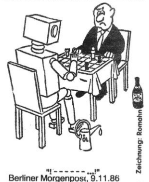
Berliner Morgenpost, 9.11.86

20. ♞e6 ♞d7 21. ♞a3 ♞e8 22. ♞f3 ♞c8 23. ♞f8: ♞f8: 24. ♞e6 ♞c7 25. ♞e5 ♞d7 26. ♞d7: ♞d7: 27. ♞ae1 ♞c8 28. ♞g5 ♞b7 29. ♞e7: ♞e7: 30. ♞c5! ♞g8 31. ♞e7: h6 (Ld7?) 32. ♞b7: - 1:0