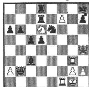
STELLUNG 88 Capablanca - N. N Simultanvorstellung