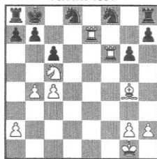
STELLUNG 106 Pfleger - Domnitz Tel Aviv 1964