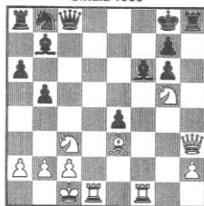
STELLUNG 108 Kavalek - Chodus Sinaia 1965