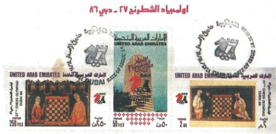
27 TH CHESS OLYMPIAD DUBAI 86

Schachmagazin und Pressespiegel für den deutschen Sprachraum