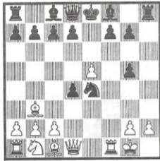
Schwarz gewinnt (s. Seite 5)