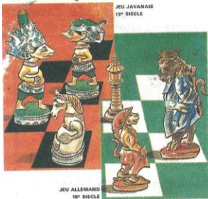
Championnat d'Echecs PREMIER JOUR D'EMISSION