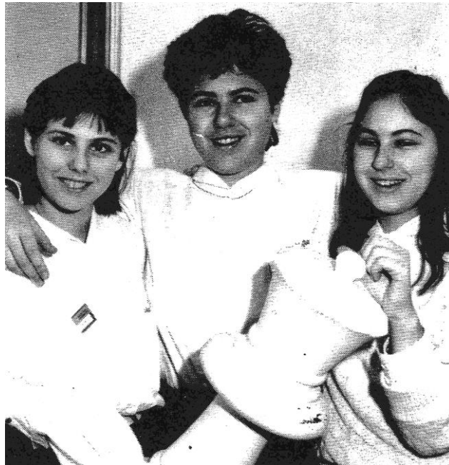
Schach macht glücklich! – Die Polgar-Sisters...