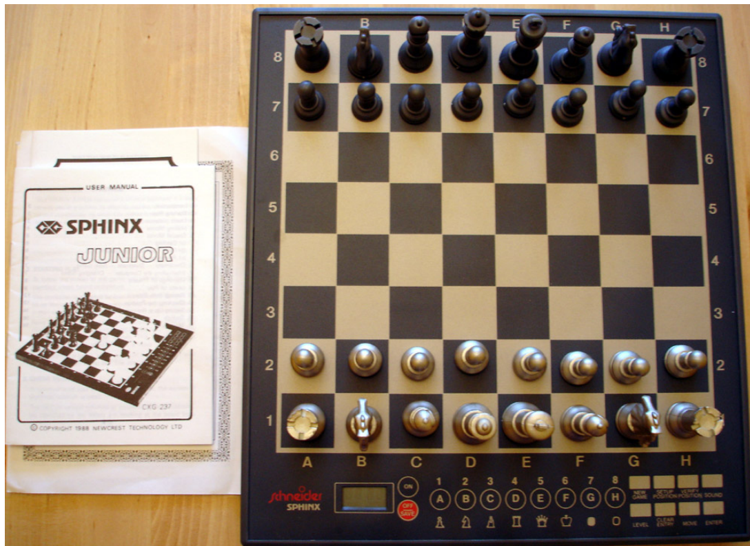
Schneider Sphinx Junior - CXG-237

Op het gebied van schaakcomputers is het merk Schneider een zuivere kloon van CXG. Natuurlijk is het verstandig om via zoveel mogelijk afzetkanalen de markt te verzadigen. Schneider Sphinx Junior was bedoeld voor de beginnende jeugdspeler. Maar eigenlijk wordt deze beginner al meteen voor het blok gezet, want hij moet wel de schaaknotatie beheersen, want alle zetten moeten via het kleine bedieningspaneeltje ingetoetst worden! Anno 1988 eigenlijk al geheel uit de tijd, want schappelijk geprijsde sensorborden waren er toen al volop.