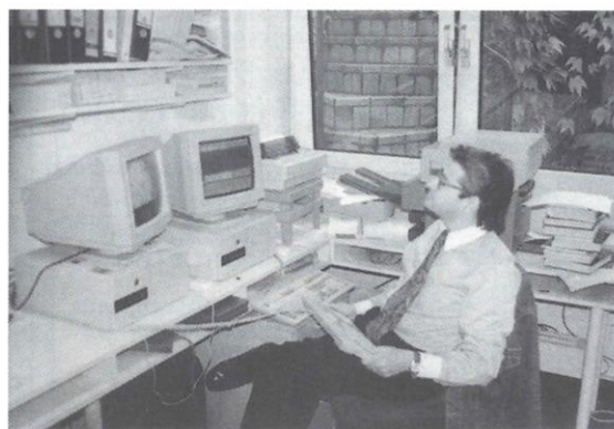
In der Entwicklungsabteilung