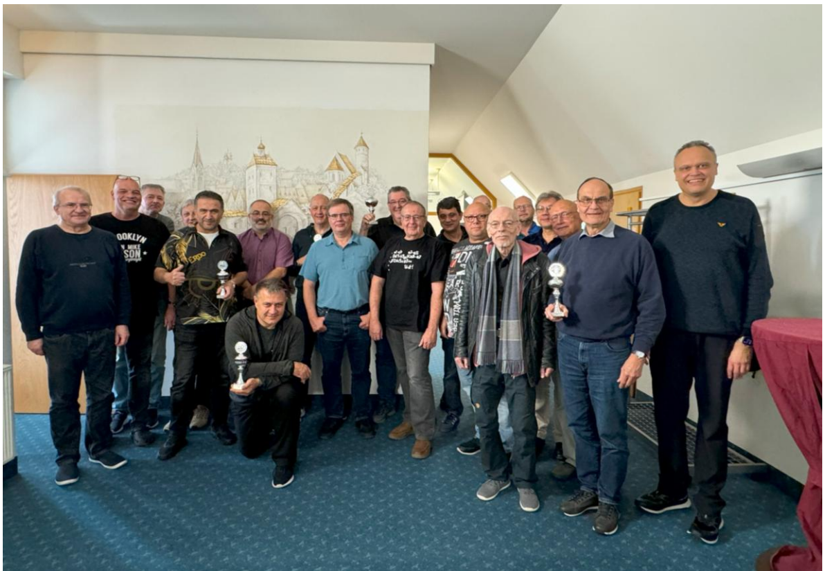
First Published on January 24, 2025 – Size: 519.211 KB