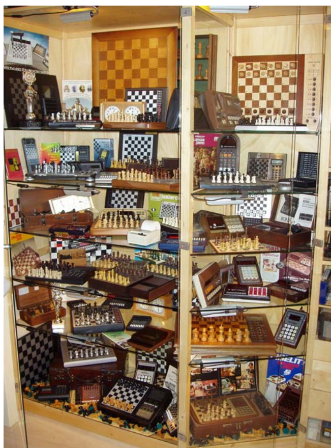
Een klein gedeelte uit de verzameling met rechtsonder in het koffertje de Fidelity Chess Challenger 10 ...

Er wordt door schakers wat afverzameld: boeken, schaakspelen, postzegels, computers, kaarten. In een serie besteedt SCHAAKmagazine aandacht aan opmerkelijke Nederlandse verzamelaars. In de tweede aflevering Hein Veldhuis. Hij bezit in Nederland de grootste collectie klassieke schaakcomputers.