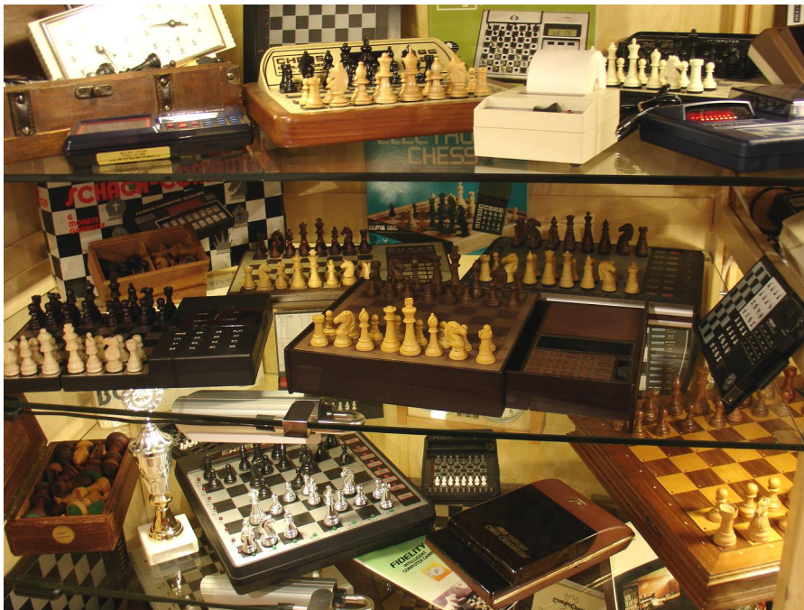
En nog een kiekje van een 'rommelige vitrinekast' ...

Alle doosjes waren voorzien van een etiket met daarop de naam van de computer waar ze bij hoorden. Ook alle adapters hadden een naamstickertje, zodat er geen verwarring kan ontstaan welke adapter bij welke schaakcomputer behoort.