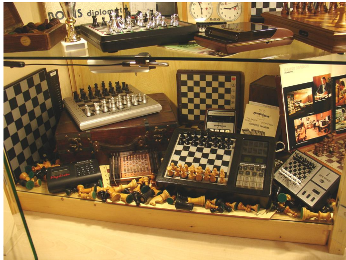
Schaakcomputers van allerlei merken en uit alle windstreken van de wereld ...

NB: Schavo is een samenvoeging van schaken en Volt. De Volt-fabriek in Tilburg was vroeger een onderdeel van Philips. De schaakvereniging Schavo ontstond vanuit de Volt-fabriek en ging na enige jaren zelfstandig en onafhankelijk verder als schaakclub waar iedereen lid van kon worden.