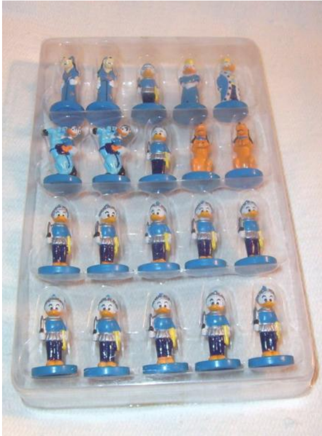
Donald Duck team ...