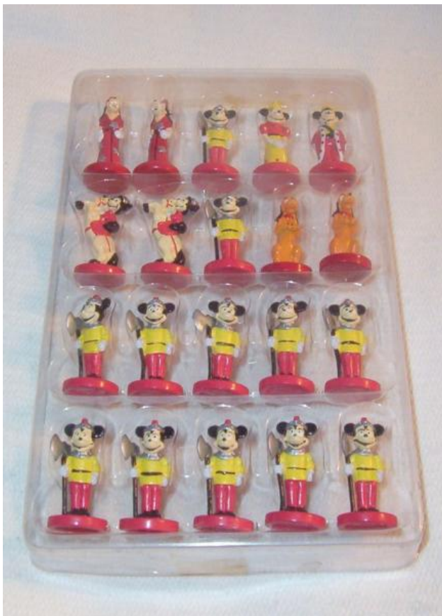
Mickey Mouse team ...