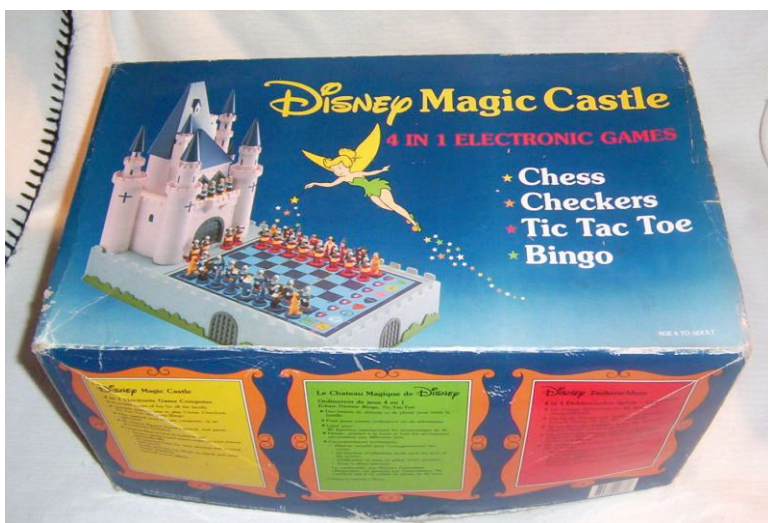
Disney Magic Castle with bleu packing

This long term memory will be only retained if batteries in the game computer or an adaptor is connected, otherwise you will lose the memory contents.