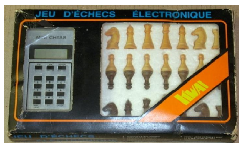
Mini Chess met originele verpakking