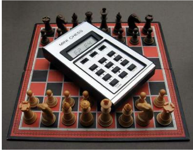
SciSys Mini Chess

Een schaakcomputertje van de allereenvoudigste soort. Het kan soms zelfs een mat in één zet overzien! Het oplossen van een mat in twee zetten is voor de Mini dan ook een hele opgave!