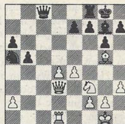
Karpov-Kasparov 17e partij: na 21. Dd3

In de diagramstelling speelde hij timide 21. ..., Te8 en werd vervolgens door Karpov weggedrukt. Veel beter was volgens Mephisto: 21. ..., Pc4 22. Lxe7 Te8 23. La3 Pxa3 24. Dxa3 Txe4 25. d5 Tc4 26. d6 Tc3 27. Da5 Tc1 (score -0,03 voor zwart).