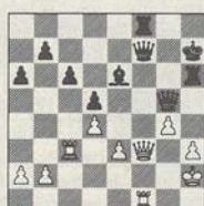
6/z Hiarc-Van Voorthuijsen (analyse)

Vijf ronden lang moest Nunn met honderd procent de eerste plaats delen met iemand die tegenwoordig aardig naar een rating van 2000 aan het afzakken is: moi. Een verklaring heb ik wel: bijna al mijn partijen gingen over de veertig zetten heen en in de uitluggerfase neemt de speelsterkte snel af. Vervelend daarbij was wel dat de computerinstellingen meerdere keren veranderd mocht worden. Bij sommige programma's zoals Hiarc was dat al actief, dus moet het een koud kunstje zijn om dat stukje logica ook bij de rest in te bouwen. Hiarc wees mij ook op enig combinatoir feilen in de onderlinge partij. Voor mijn ogen had de volgende stelling gezweefd en ik had de winst niet gevonden. U wel?