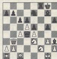
2/z Mephisto Berlin-Nunn

na de ander opgerold en af en toe een eindspelletje er tussendoor. Toch nam hij meer risico dan verleden jaar. Hoe greep hij zijn kans in onderstaande stelling en wat is wits beste verdediging?