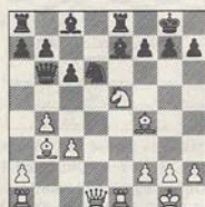
5/w Bronstein-Saitek Brute Force

maar als het bruter kon: nou graag. Hoe hakte hij zich hier door het zwarte kreupelhout?