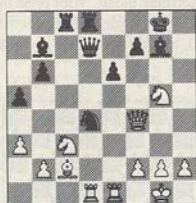
1/w Ligterink-TASC R40

oogpunt nu een andere zet moest doen. Gelukkig bleef de gerechtigheid meester en verblunderde de computer een remise-eindspel. Welke winst had de meester hier gezien?