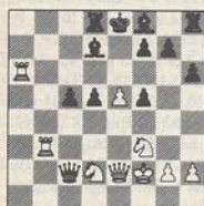
3/w Pa Piket-Pandix

lijnen te krijgen moet wit verder op weg naar de koning. Hoe lukte dat?