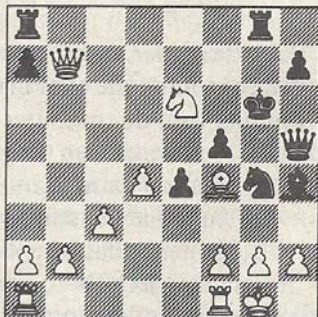
Gandalf-Van Geet (w)