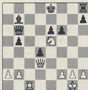
Botwinnik-Euwe Moskou 1948

heeft evenwel een meedogenloze actie in petto: