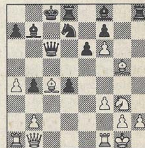
Denker-Botwinnik Radiomatch USA-USSR 1945

Tijdens de barre oorlogsjaren kwamen er geen berichten uit Rusland door. Pas in de zomer van 1945 hoorden we dat Botwinnik prachtige successen had geboekt en duidelijk de absolute leider van het Russische schaak was geworden. De partijen, die hij in de Radiomatch USA- USSR 1945, van de Amerikaanse kampioen Arnold Denker had gewonnen, spraken duidelijke taal. Hiervan een enkel fragment.