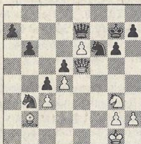
Botwinnik-Capablanca AVRO-toernooi 1938

op dreef was. Als negenjarige heb ik er destijds vermoedelijk niet veel van begrepen. Later kwam Botwinnik in deze dubbelronde achtkamp met de beste spelers van de wereld goed terug; hij bezette uiteindelijk na Fine en Keres de derde plaats voor Aljechin, Euwe, Reshevsky, Capablanca en Flohr. Zijn partij met Capablanca, die later de schoonheidsprijs kreeg, heb ik sindsdien tientallen malen nagespeeld.