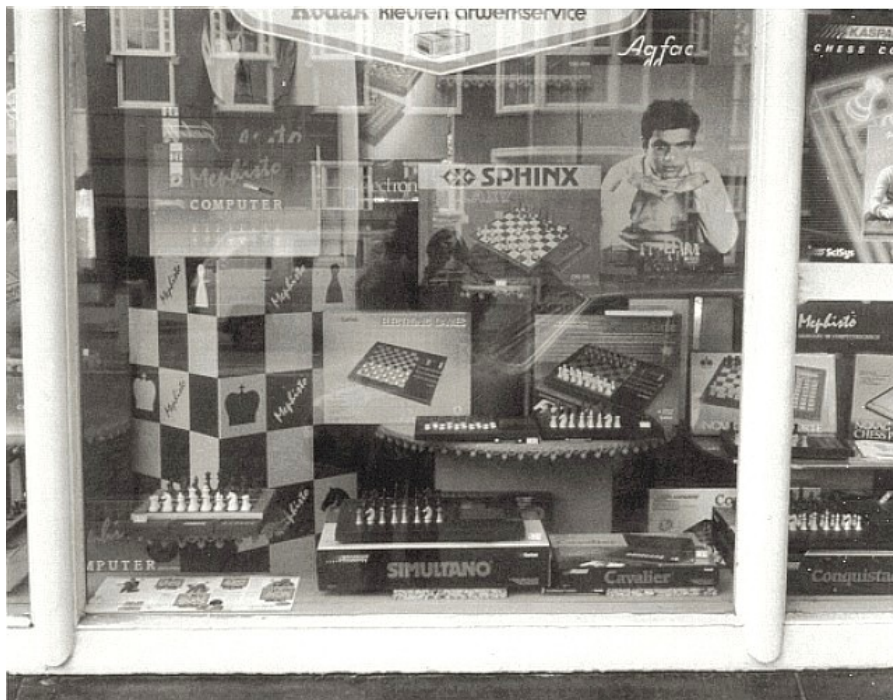
Het etalageraam van Foto Witteman uit 1988. Duidelijk is te zien dat foto-accessoires toen al op de tweede plaats kwamen!