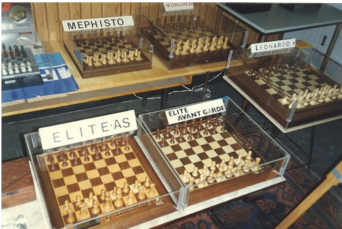
uit 1986. De kostbare houten modellen werden afgeschermd met een glasheldere plexiglazen kap. Niet alleen voor het stof, maar zeker ook voor de klanten!