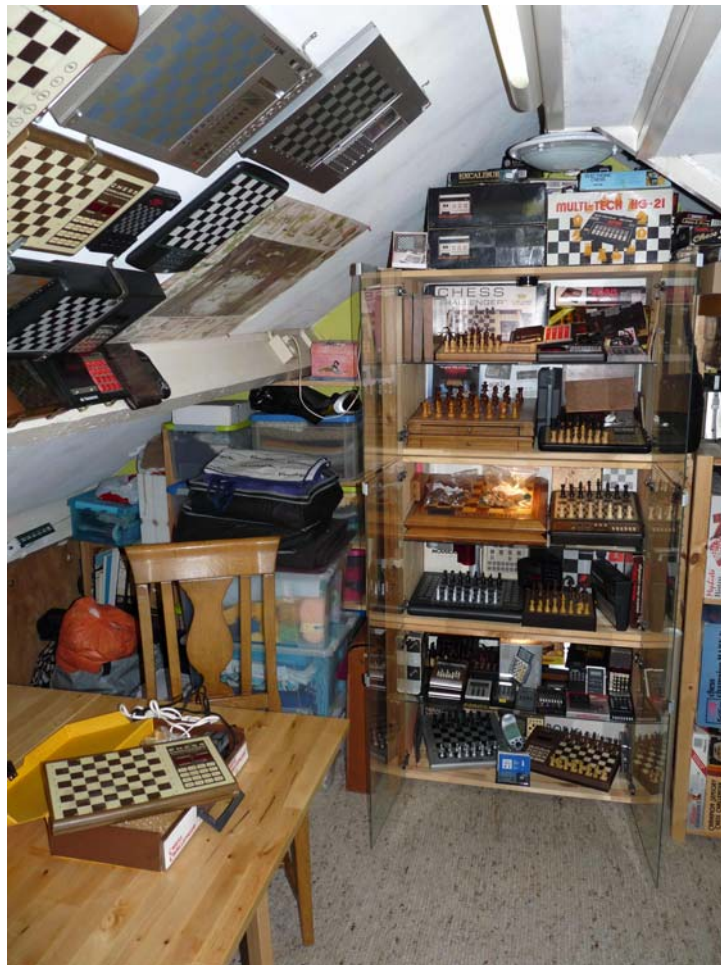
Je ziet het zeker niet direct, maar in het kleine heiligdom van Luuk staan ruim 350 schaakcomputers!

Ik kijk verder om mij heen en zie, zoals het een echte verzamelaar betaamt, een grote vitrine staan met daarin een selectie met de mooiste en zeldzaamste schaakcomputers ooit gemaakt. De vitrine kan verlicht worden, zodat het antieke elektronische schaakvernuft nog als nieuw getoond kan worden. Het lijkt alsof de tijd hier stil gestaan heeft.