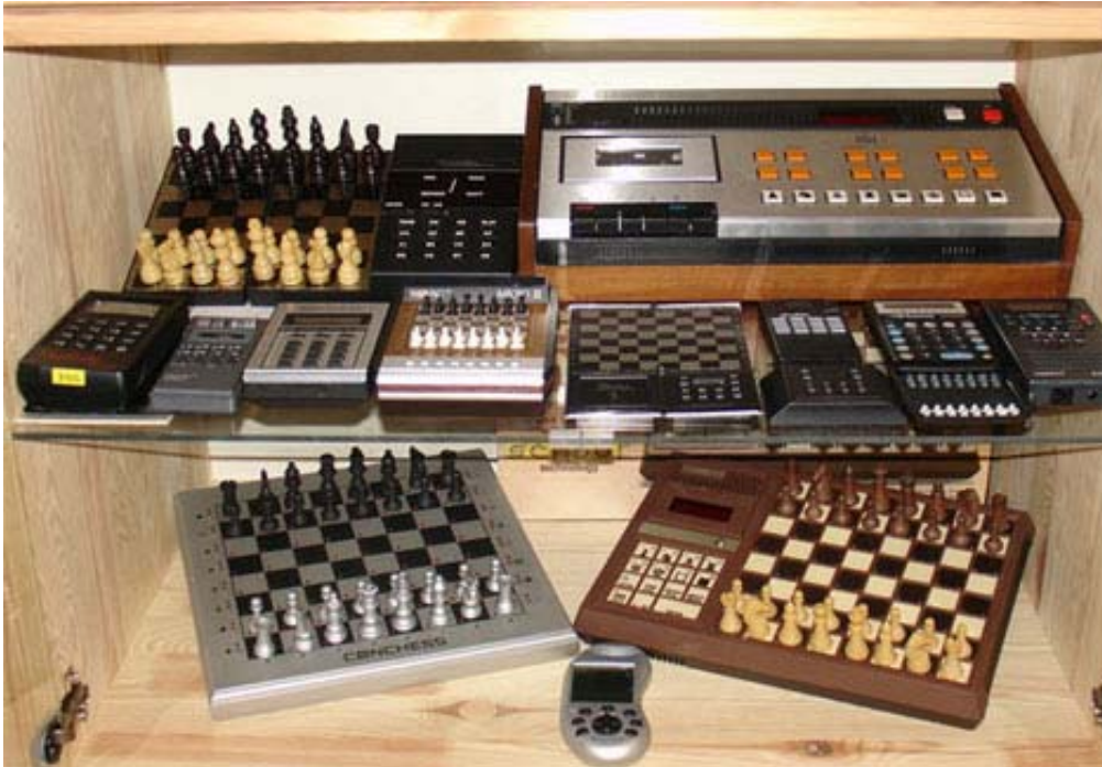
Nog een blik in de vitrinekast van Luuk met vele modellen uit vooral de jaren '80.

Luuk: "Met het instorten van de schaakcomputermarkt en de opkomst van de software, viel mijn interesse voor computerschaak bijna geheel weg. De PC's volgden elkaar in een rap tempo op en werden steeds krachtiger. Ook de schaakprogramma's werden steeds sterker en al gauw had je een elektronische grootmeester in huis. Ik beschouw de 'dedicated' schaakcomputer en de schaaksoftware als twee verschillende werelden. In de tweede helft van de jaren negentig kwamen daar ook nog eens de mens-machine tweekampen bij, zoals die tussen Kasparov en Deep Blue. Deze partijen werden gespeeld op een niveau waar ik helemaal niets van begreep. Ik heb mijn verzameling schaakcomputers niet weggedaan, maar wel in een diepe kast op zolder gestopt en er niet meer naar omgekeken."