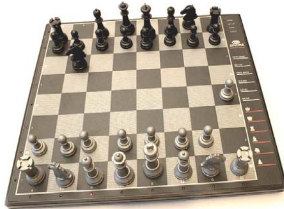
CXG Sphinx Granada (old edition = CXG-247)

CXG Sphinx Granada met modelnummer CXG-247 kwam in november 1989 op de commerciële markt. Dit item gaat over de eerste modeluitvoering van de Granada (old edition) want na de overname van CXG door National Telecommunication System, verscheen er in de lente van 1992 een tweede modeluitvoering (CXG-347) met een nieuwe behuizing (new edition).