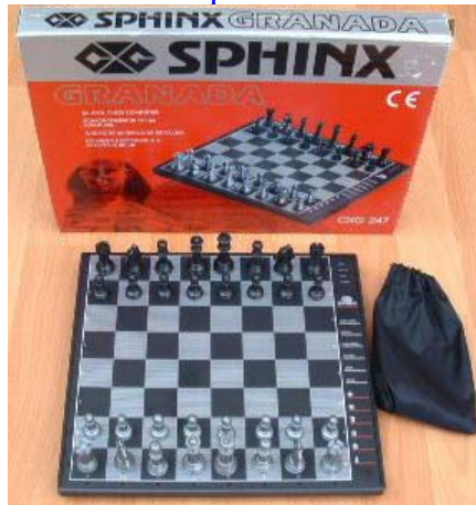
CXG Sphinx Granada Old edition = CXG-247 met rode verpakking!