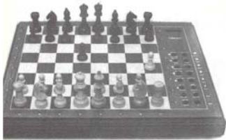
Novags neues (Monster) Gerät hat noch keinen Namen