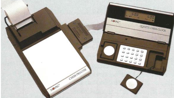
NOVAG CHESS PRINTER Art.-Nr. 816