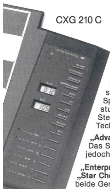
CXG 210 C