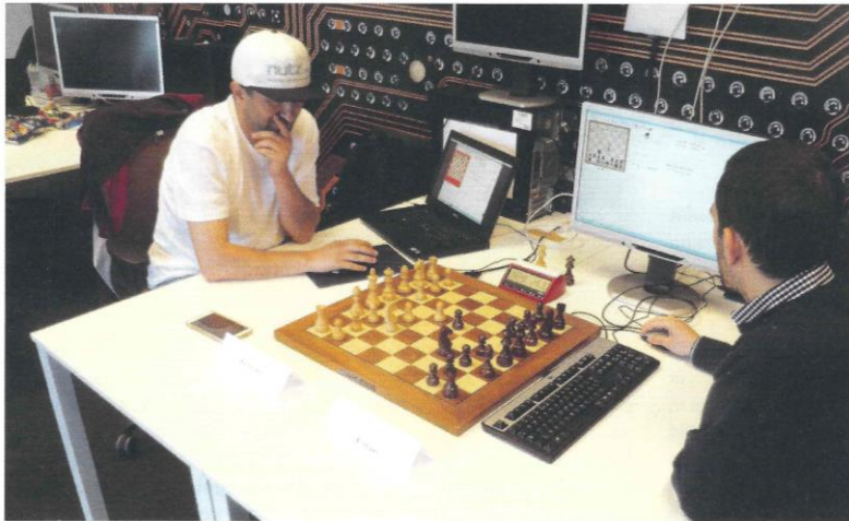
Komodo tegen Chiron

algoritme slagen de beste schaakprogramma's er steeds beter in om deze patronen op een slimme manier te selecteren en met elkaar te combineren."